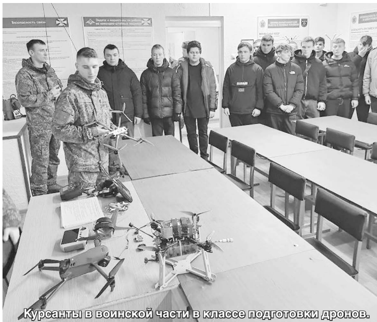
Курсанты в воинской части в классе подготовки дронов.