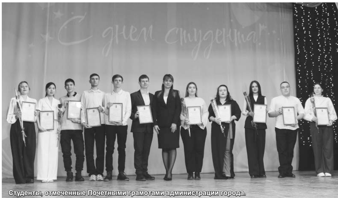
Студенты, отмеченные Почетными грамотами администрации города.

23 января 2025 года во Дворце культуры им. Гагарина состоялось яркое и запоминающееся мероприятие, посвящённое Дню российского студенчества. Большой зал был полон: здесь собрались студенты городского вуза и учреждений СПО, преподаватели и просто жители Каменска-Шахтинского, желающие разделить с молодёжью атмосферу праздника.