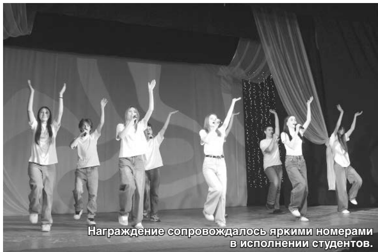
Награждение сопровождалось яркими номерами в исполнении студентов.