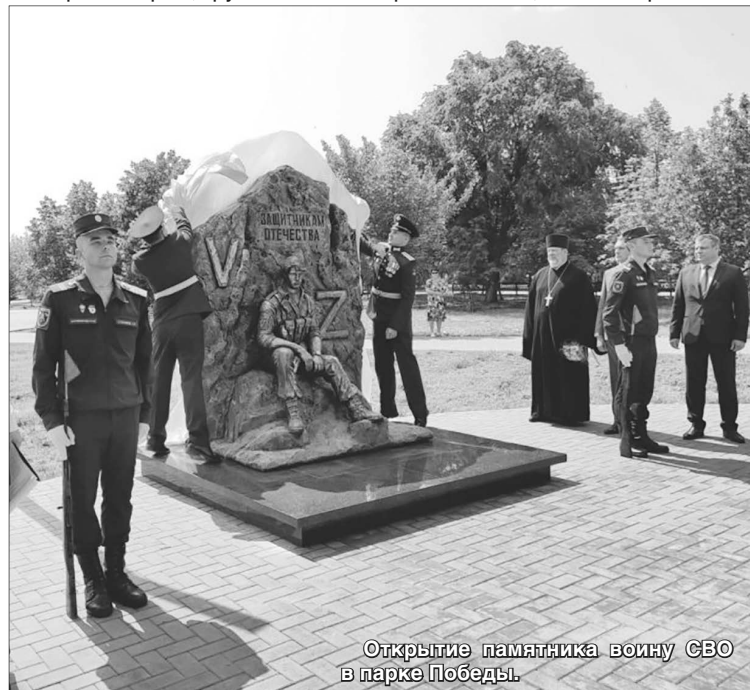
Открытие памятника воину СВО в парке Победы.