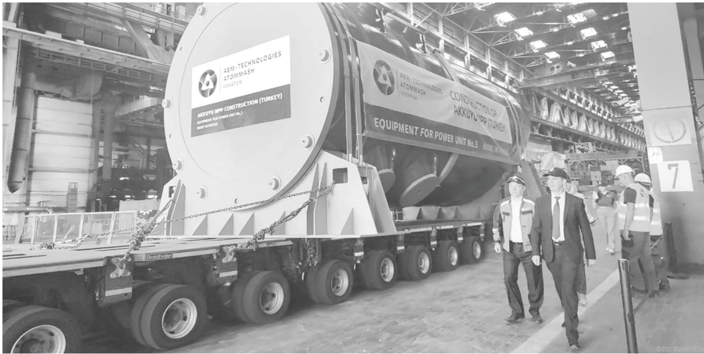
Промышленные предприятия Ростовской области выпускают уникальную продукцию, востребованную как в России, так и далеко за рубежом нашей родины

На завершающем этапе – инвестиционный импортозамещающий проект по расширению производства легкосплавных дисков «Азов-ТЭК», запуск запланирован на 4 квартал 2025 года. «Ростовский трубный завод» на своей дополнительной площадке в Аксайском районе начал выпуск полиэтиленовых труб в тестовом режиме, здесь уже завершены строительно-монтажные работы складского блока, монтаж четырех производственных линий, аккредитована лаборатория. «НЭВЗ» запланировал масштабную модернизацию производства, что позволит увеличить объемы выпуска электровозов, также в планах – разработка новых видов техники.