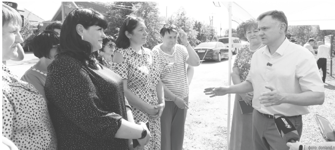
Общение с жителями о том, что уже сделано в районе, и том, что нужно сделать – обязательная часть любой рабочей поездки главы региона

Сейчас устанавливают медоборудование, а уже с 1 августа примут первых пациентов в терапевтическом отделении, потом от-