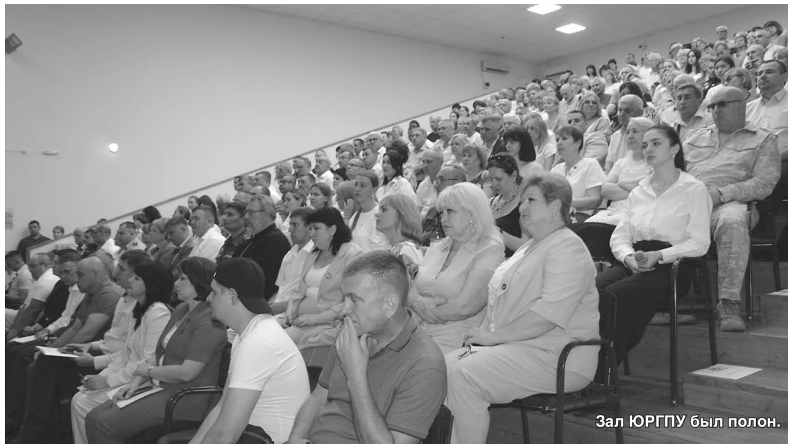
Зал ЮРГПУ был полон.

миллиардов рублей. Планируется открытие 500 новых рабочих мест. Будущий комплекс будет работать в том числе с партнерами из ДНР и ЛНР.