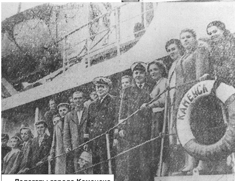
Делегаты города Каменска на одноименном судне. Газета «Труд», 1959 год.

имя пароходу. Молодёжь обменивалась письмами и телеграммами, многие из них публиковались в нашей газете «Труд». Делегации бывали в гостях друг у друга, привозили памятные подарки и интересовались достижениями.