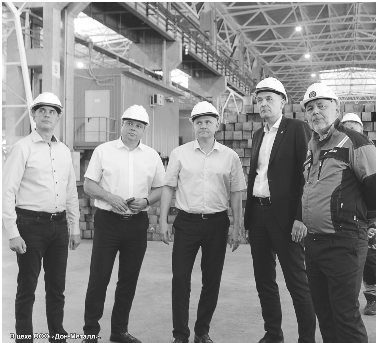
В цехе ООО «Дон-Металл».

11 июля 2025 года в Каменске-Шахтинском с рабочей поездкой побывал глава правительства Ростовской области Ю. Б. Слюсарь. Это первый визит Юрия Борисовича в наш город.