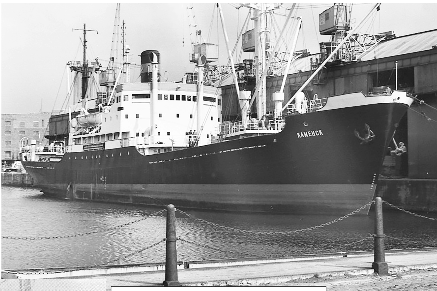
«Каменск» — тренажерное судно Балтийского морского пароходства.

Каменчане старшего поколения наверняка помнят, какие тёплые дружеские связи установились между членами экипажа и трудящимися и школьниками города Каменска, подарившего