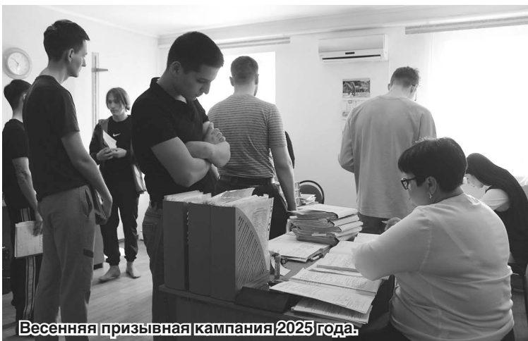
Весенняя призывная кампания 2025 года.

Подготовила Анна БАБИНЦЕВА.