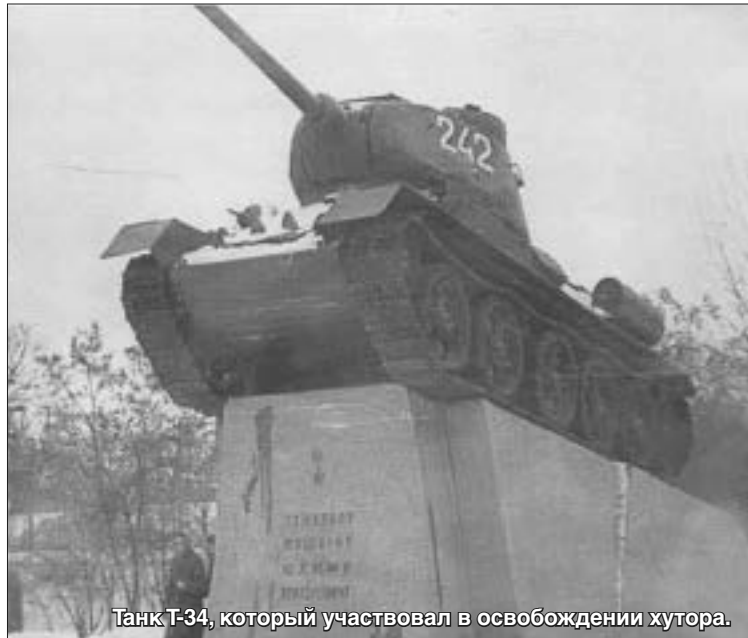
Танк Т-34, который участвовал в освобождении хутора.