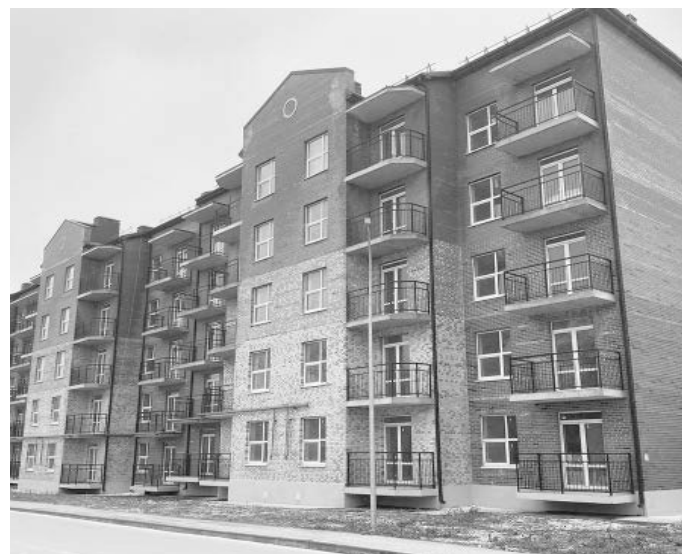
3348 человек в 2024 году переехали из аварийного жилья в новые квартиры

В Ростовской области продолжают решать вопросы переселения людей из аварийных домов.