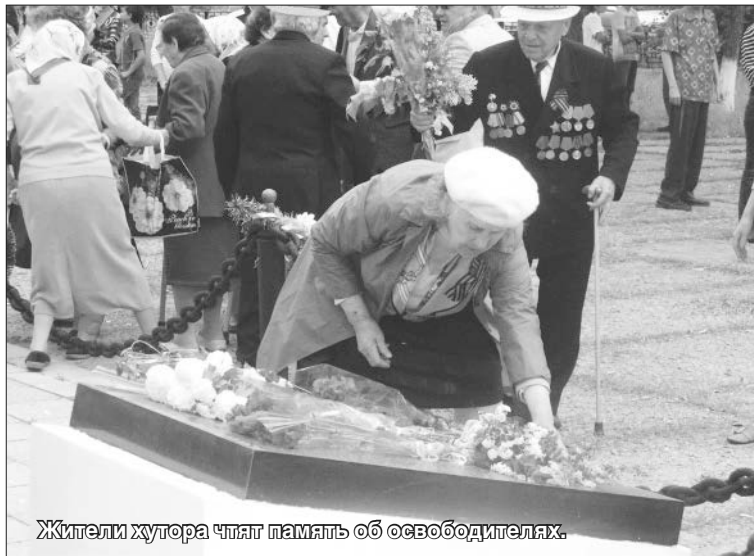
Жители хутора чтят память об освободителях.

но она не взорвалась. Выскочивший во двор немецкий унтер-офицер выстрелил в нашего десантника. Танкетка, развернув башню, открыла ответный огонь из пулемёта. Немцы, хаотично отстреливаясь, отступили в сторону Каменска.