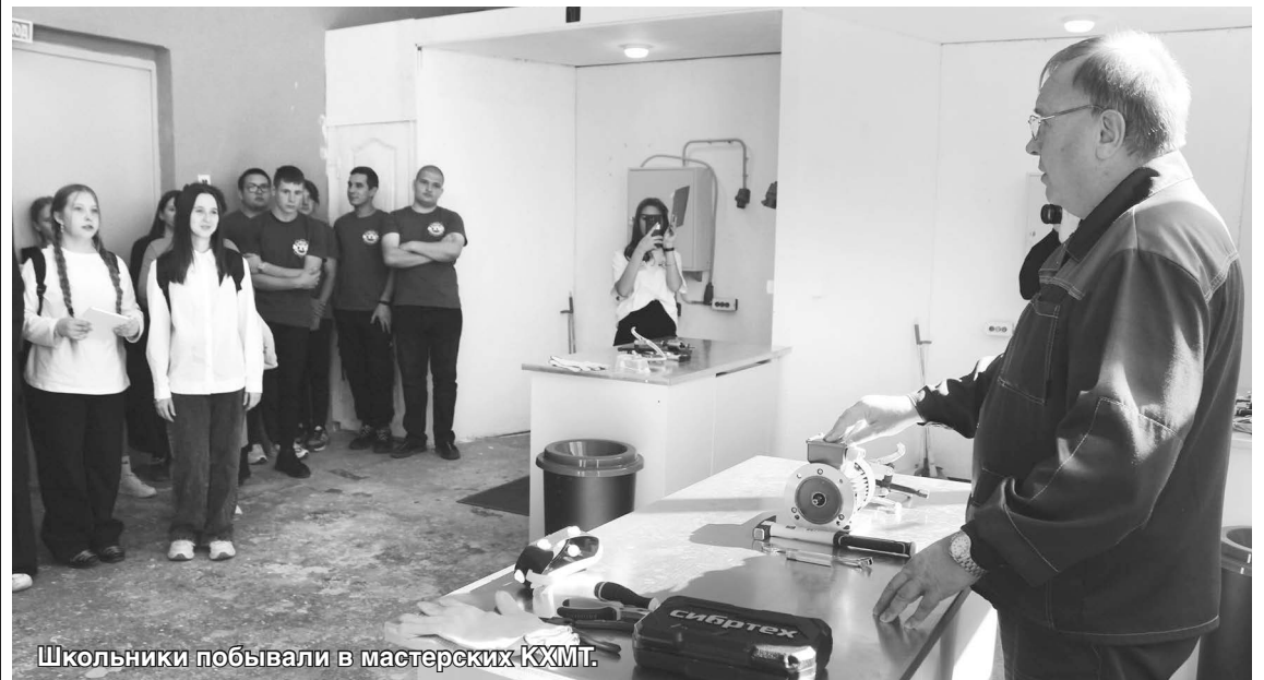
Школьники побывали в мастерских КХМТ.

На десять дней – с 24 сентября по 3 октября 2024 года – наш город стал одной из десяти площадок Ростовской области по внедрению единой модели профессиональной ориентации. Учредителем фестиваля «Топ-Регион» выступает Министерство общего и профессионального образования при поддержке Института развития образования и Центра опережающей профессиональной подготовки Ростовской области.