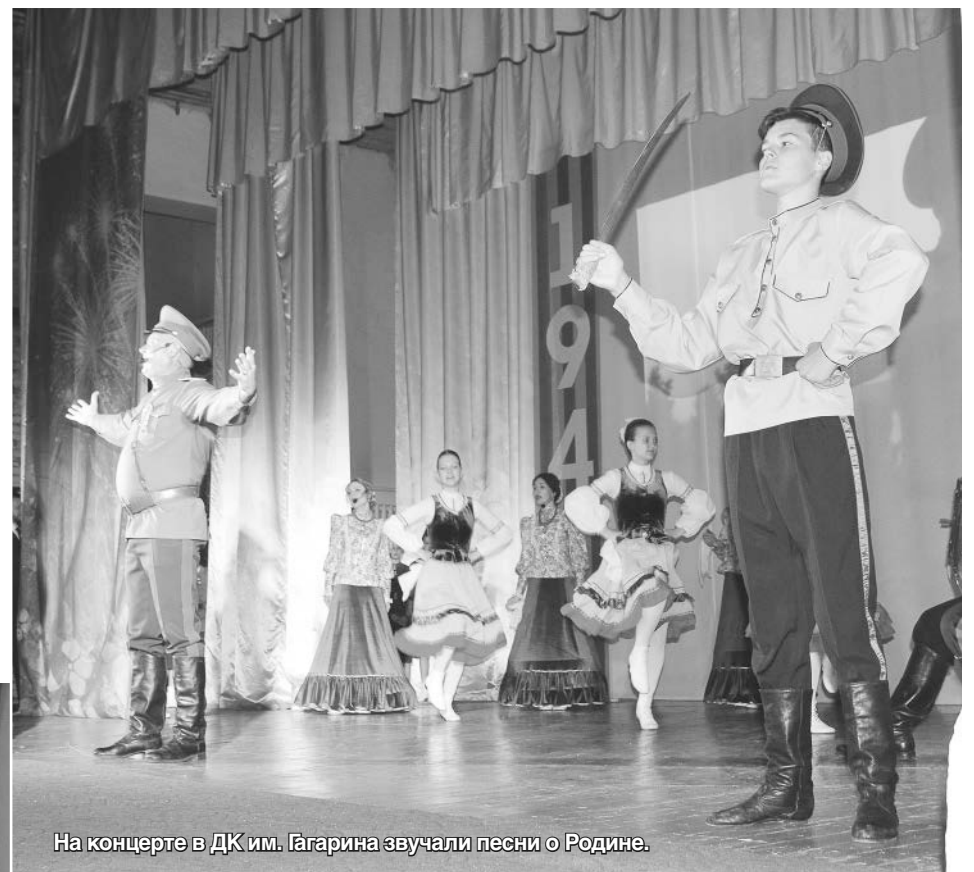
На концерте в ДК им. Гагарина звучали песни о Родине.