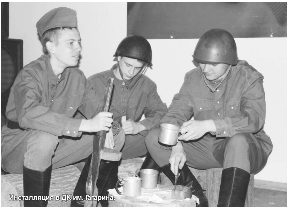
Инсталляция в ДК им. Гагарина.