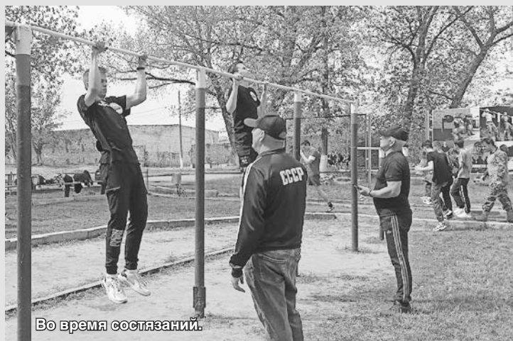
Во время состязаний.

В конце апреля в Каменске-Шахтинском на территории 11 ОИБр прошел муниципальный этап всероссийских военно-патриотических игр «Зарница 2.0» и «Орленок». В соревнованиях приняли участие отряды школ №№1, 2, 8, 9, 10, 11, 14, 18, лицея №5, гимназии №12, Каменского педагогического колледжа, Каменского химико-механического техникума и Лиховского техникума железнодорожного транспорта.