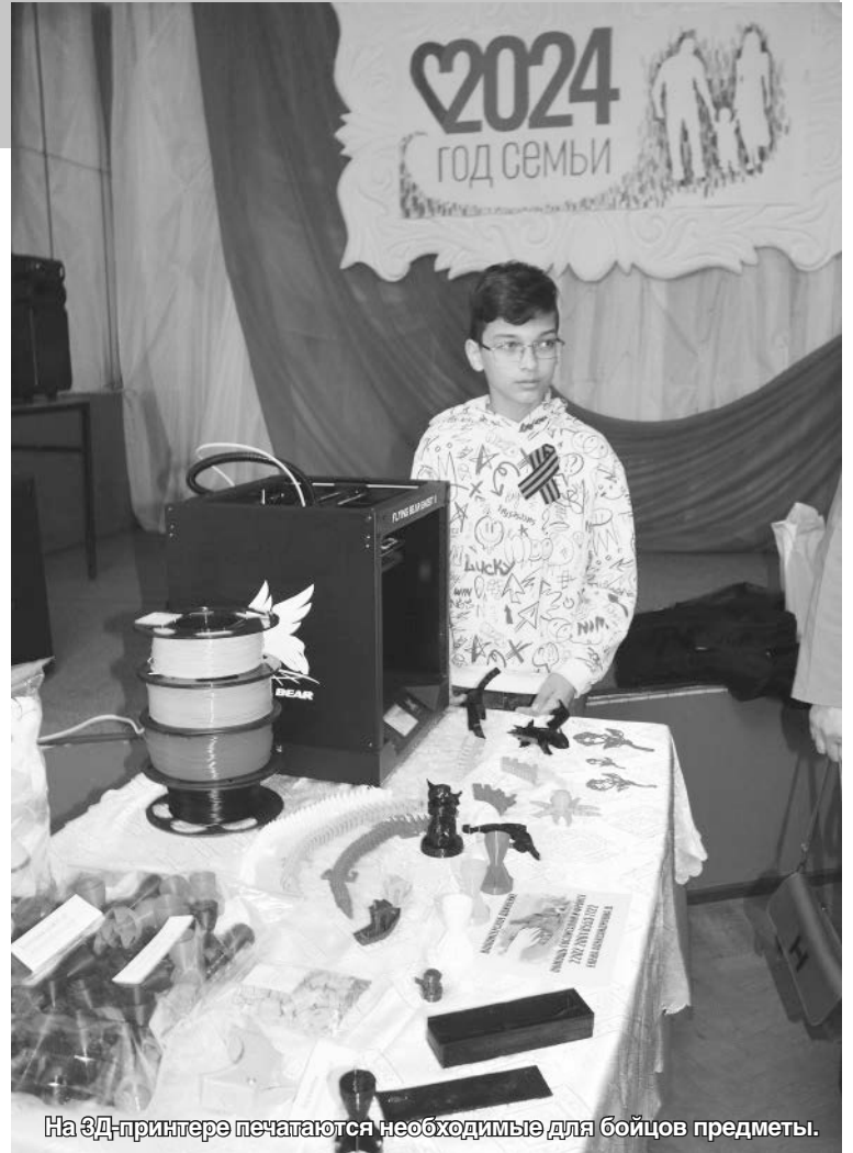
На 3D-принтере печатаются необходимые для бойцов предметы.