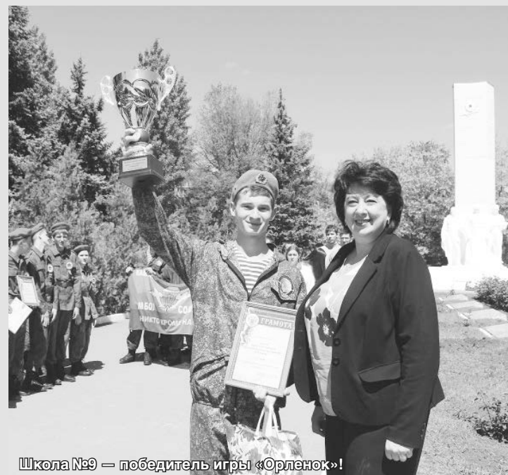
Школа №9 — победитель игры «Орленок»!

«Зарница» и «Орленок» — известные традиционные военно-патриотические игры, любимые многими поколениями. Это не просто развлечение, а настоящее воспитание командного духа, воли к победе, смелости и выдержки.