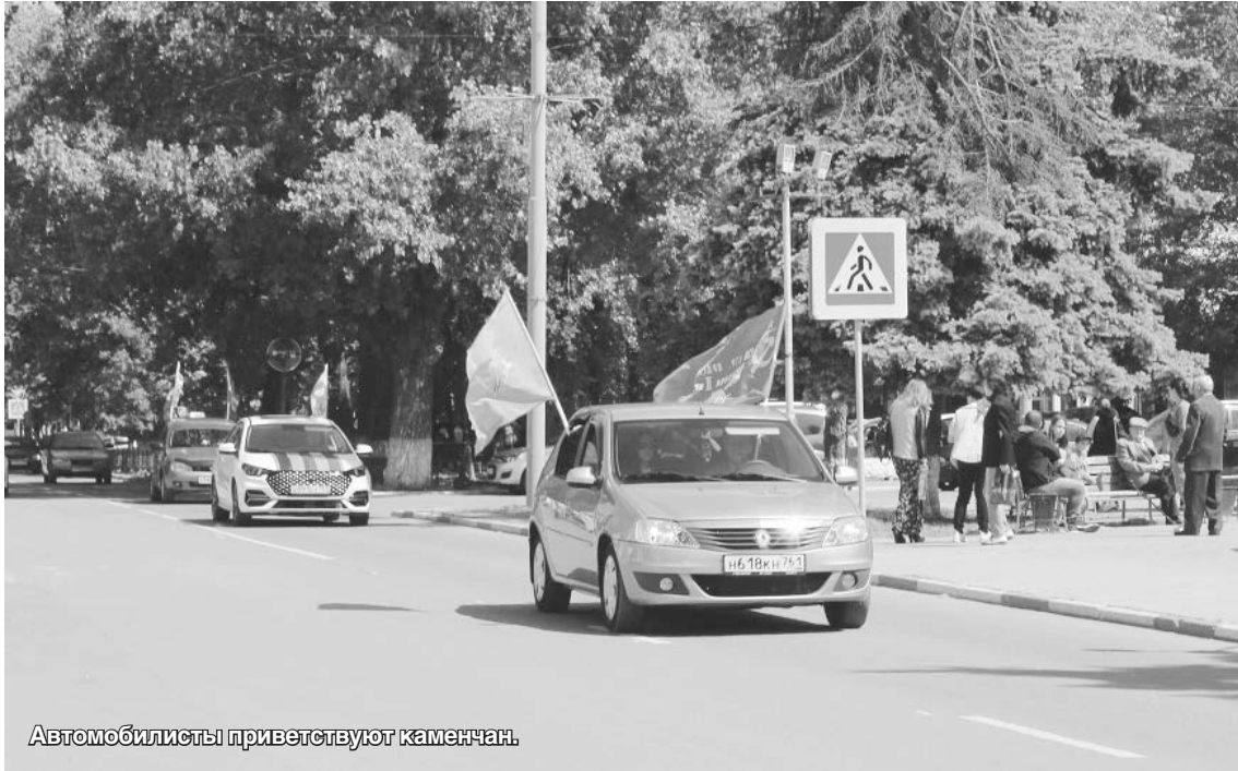
Автомобилисты приветствуют каменчан.

пой «Помощь госпиталям и фронту» и местным отделением «Движения Первых». Волонтеры подробно рассказали о своей деятельности в помощь участникам СВО. Через каменских добровольцев передают гуманитарные грузы неравнодушные граждане из Москвы, Ижевска, Воронежа, Йошкар-Олы и других городов. Также интересно, что множество нужных предметов рождаются в руках каменских мастеров и