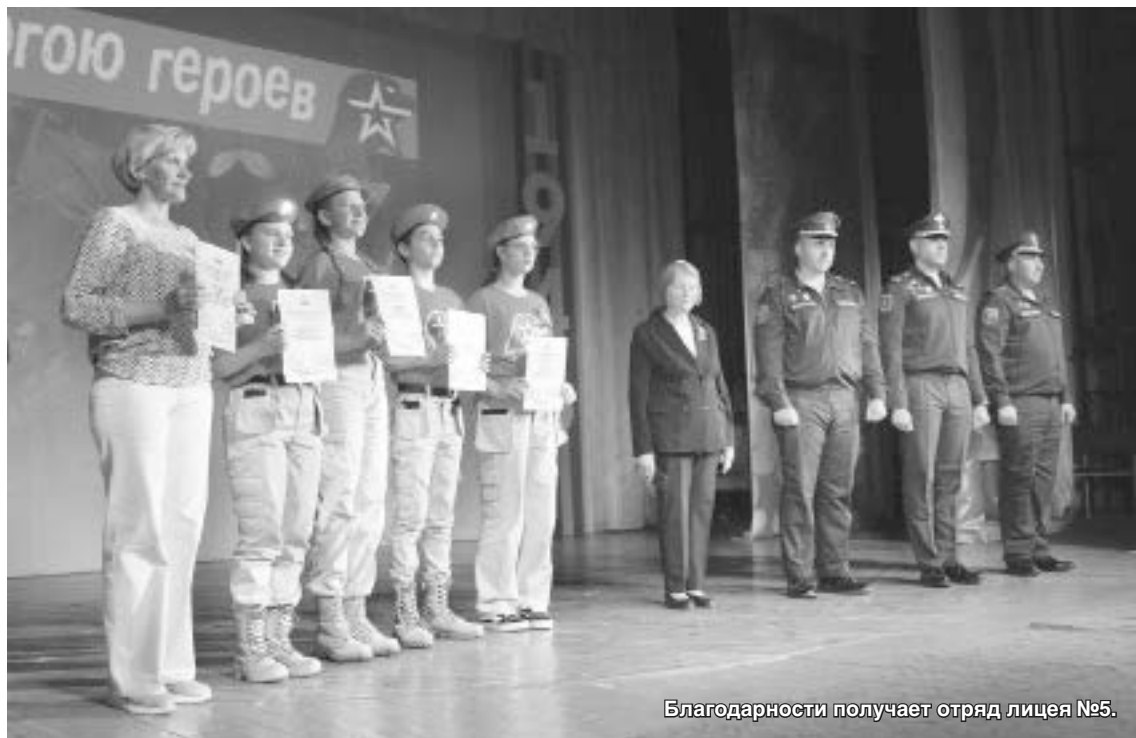
Благодарности получает отряд лицея №5.

Движение «Юнармия», созданное в 2016 году по инициативе министра обороны РФ Сергея Шойгу, уже объединило более миллиона детей и подростков по всей стране, региональные штабы представлены в 89 регионах России. В нашем городе работает тринадцать юнармейских отрядов.