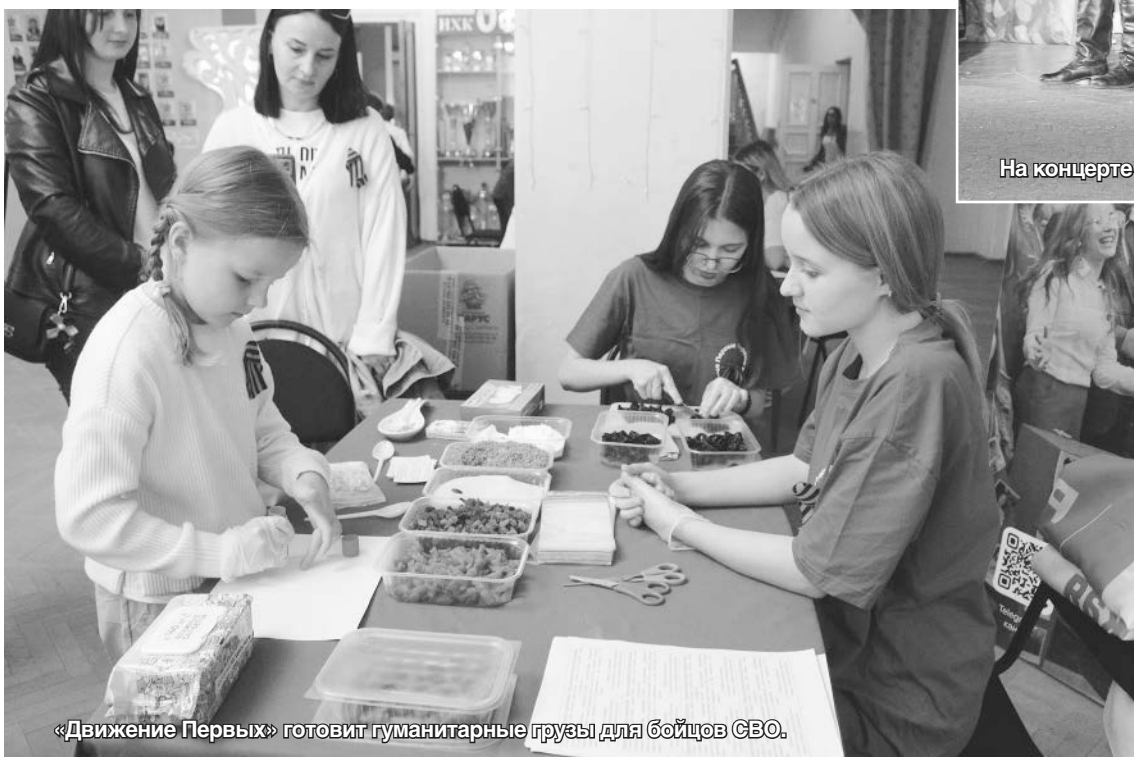
«Движение Первых» готовит гуманитарные грузы для бойцов СВО.

мастериц. Это окопные свечи, маскировочные сети, тёплые носки и другое.