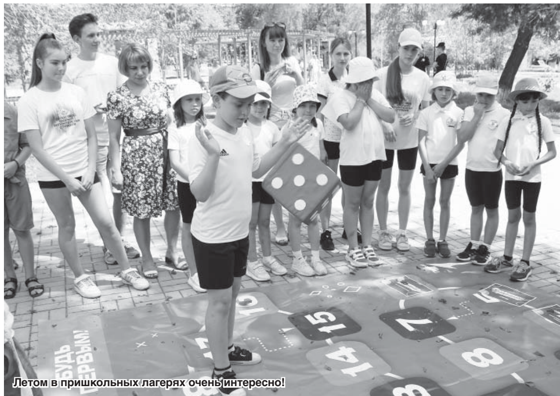
Летом в дошкольных лагерях очень интересно!

В городе будут работать восемь дошкольных лагерей. На базе школ №№ 1, 2, 8, 9, 10, 11, 17 летние площадки будут организованы с 3 по 26 июня, на базе