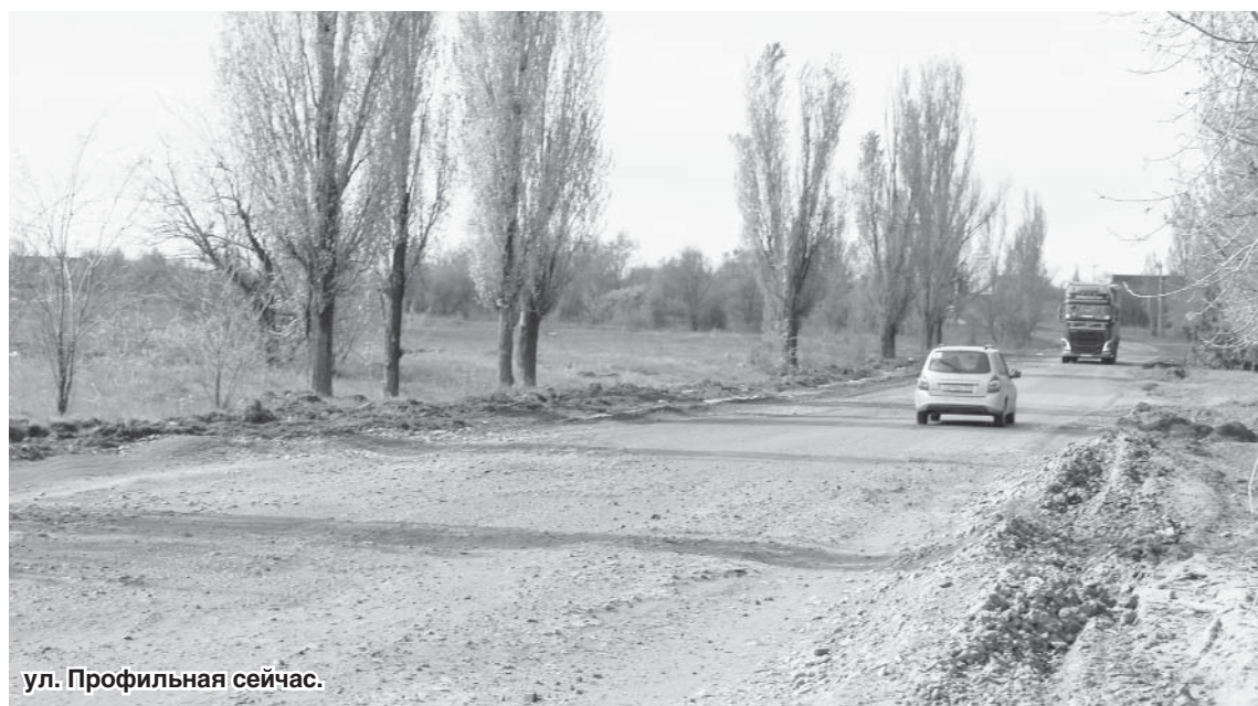
ул. Профильная сейчас.

— А на какой период запланирована разметка автодорог?