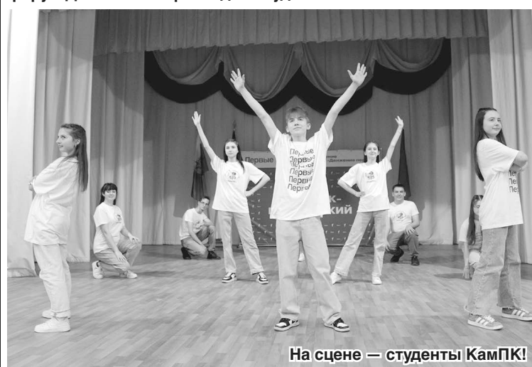
На сцене — студенты КамПК!

9 апреля 2024 года в стенах КТИ (ф) ЮРГПУ (НПИ) им. М. И. Платова собрались представители учреждений среднего профессионального образования из Гуково, Донецка, Зверево, Красносулинского района и Каменска-Шахтинского. Здесь прошёл региональный форум Движения Первых для студентов СПО.